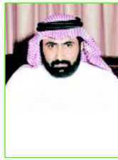
د. مفلح بن ربيعان

أكد الدكتور مفلح بن ربيعان القحطاني نائب رئيس الجمعية الوطنية لحقوق الإنسان في أن الجمعية ترى أن هناك إهمالاً في حقوق المعوقين وتقصيراً من جانب العديد من الجهات الحكومية، وقال يجب أن يحصل المعوقون والمصابون بأمراض التوحد على حقوقهم كاملة مؤكداً أن حكومتنا الرشيدة تصدر العديد من القرارات والتعليمات للاهتمام بالمعوقين بل وفرض نسب معينة من النسب الوظيفية خاصة بهم وتحديد مواقع في جميع المنشآت الحكومية ولكن للأسف